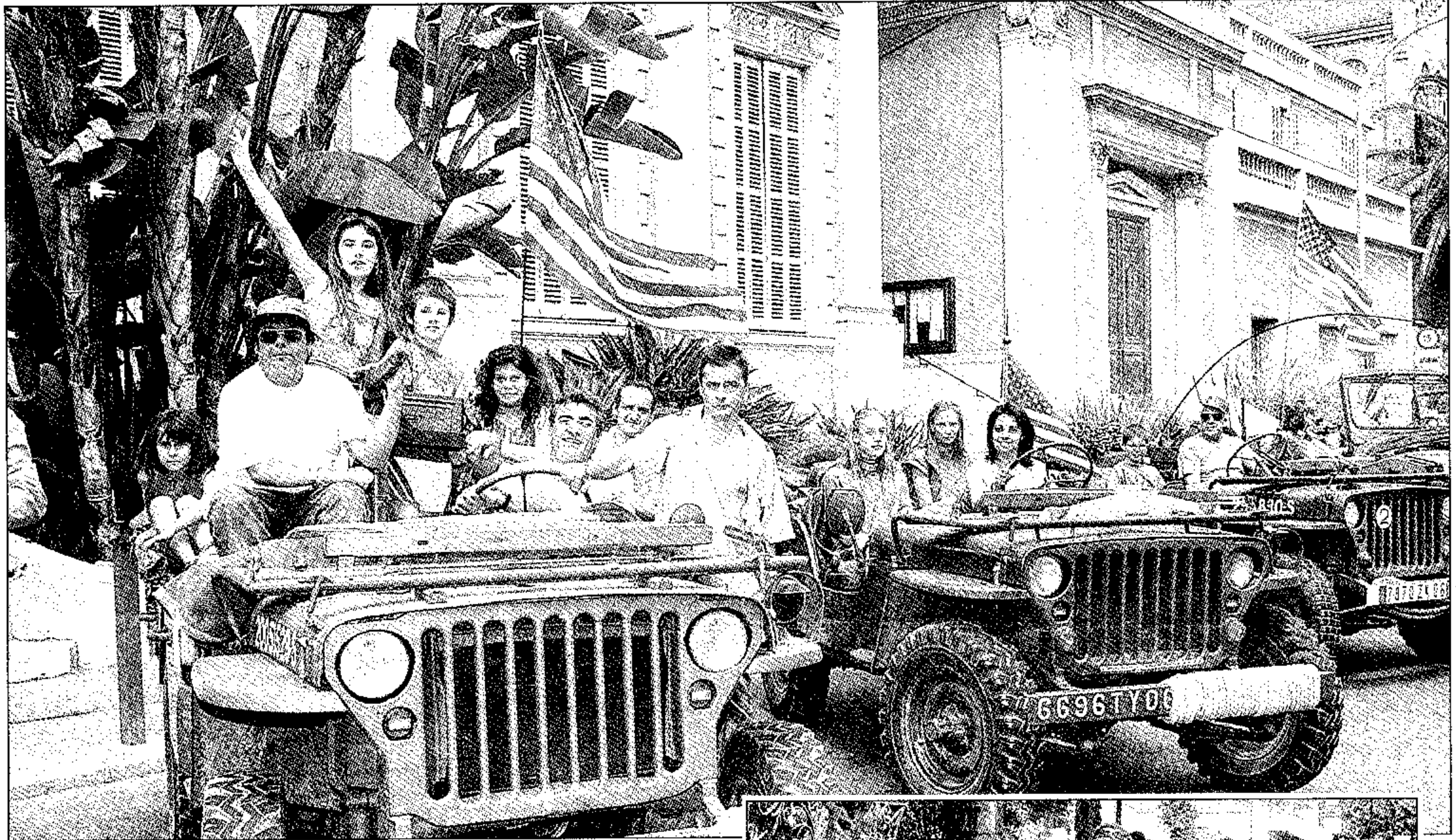
Blanche ou kaki, la Jeep, incontestable vedette de la concentration.

Un convoi militaire rétro a envahi bruyamment la ville dans le cadre du rassemblement de l'AMICORF qui se poursuit aujourd'hui encore au Rondelli. 25 véhicules au rendez-vous