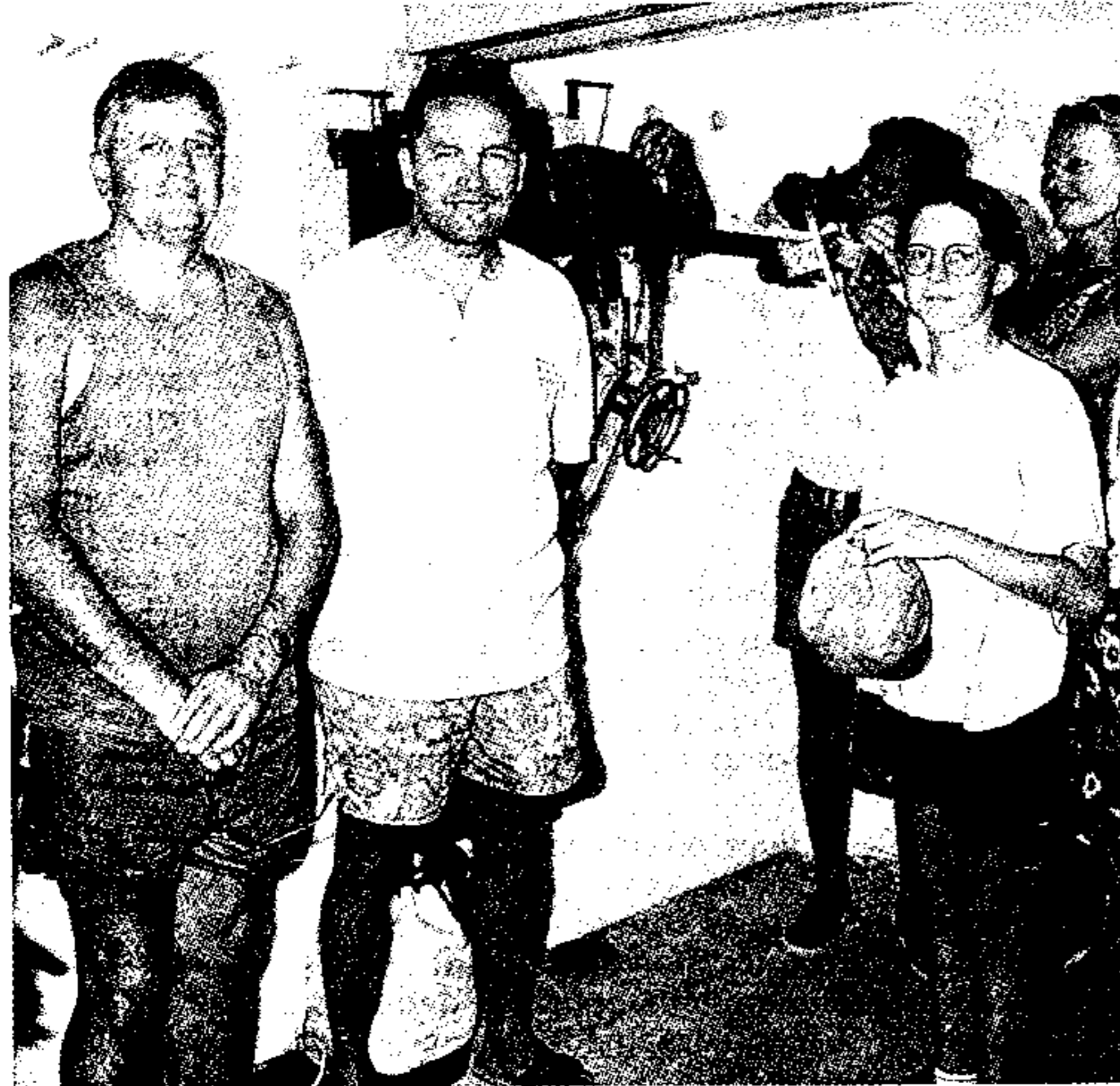
Dans la casemate du Pont Saint-Louis, devant les support de mitrailleuses rénovées.

Un première exemple de réussite avant bien d'autres certainement.